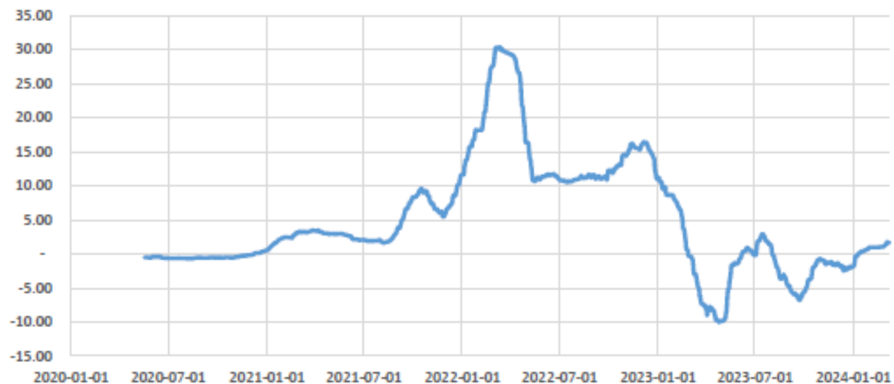
进口锂辉石硫酸法直接制取利润 (万元/吨)